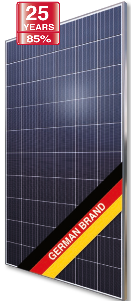
Abb. ähnlich 60MDE190513A

Exklusive lineare AXITEC Höchstleistungs-Garantie!